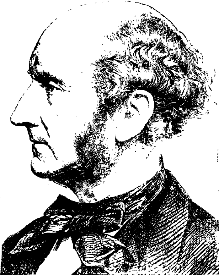
नन्वेन्ना जॉन स्टुअर्ट मिल.